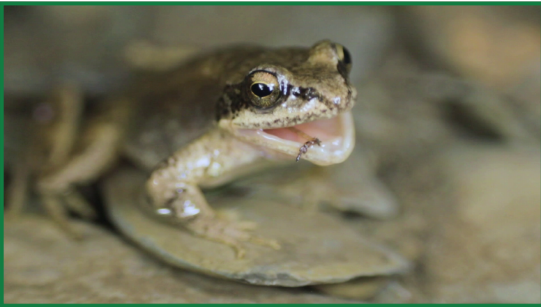
Grenouille des Pyrénées