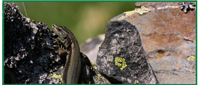
Lézard de Bonnat